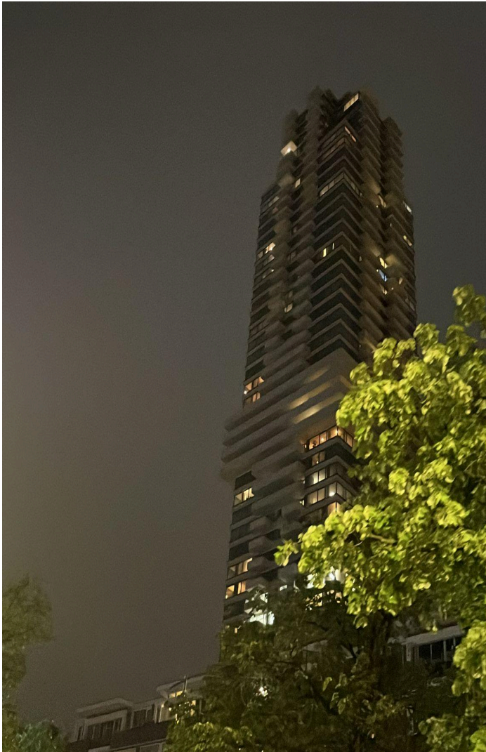
Amsterdam, con sus pintorescos canales y su rica historia, me cautivó con su encanto único.